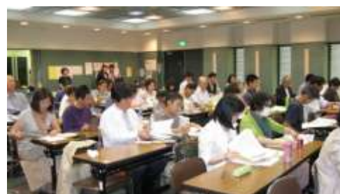
熱心に聴講する参加者