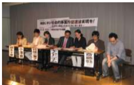
5月21日 「シンポジウム」 パネリストの皆さん